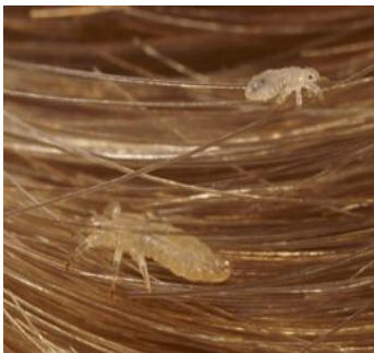
Imagen de piojos de verdad